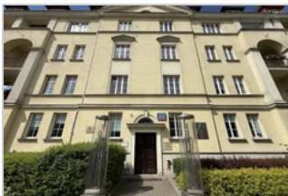
Das Mietshaus in der Niepodległości-Allee 223 im Warschauer Stadtteil Ochota, ... 000