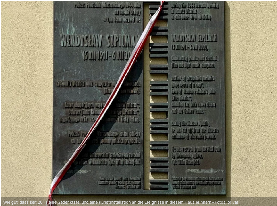
Wie gut, dass seit 2011 eine Gedenktafel und eine Kunstinstallation an die Ereignisse in diesem Haus erinnern

FULDA/WARSCHAU Ein Ort der Menschlichkeit